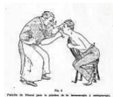
14c. Bronco-esofagoscopia 1921