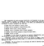
9c. Segmentación medicina y cirugía